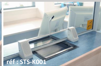
Sailli avec bar bridge

Les kits sont composés des éléments suivants :