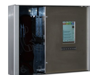
Version avec façade Inox